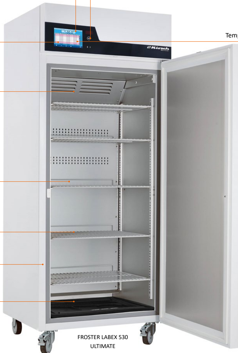
FROSTER LABEX 530 ULTIMATE