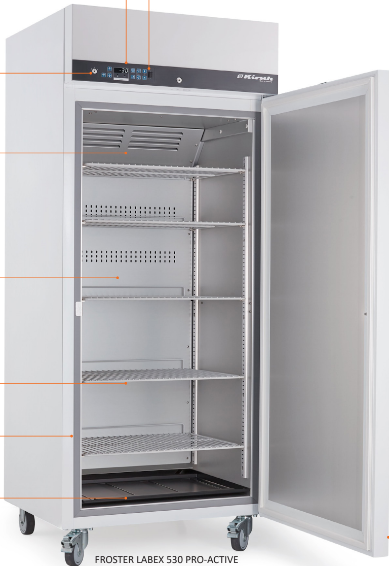
FROSTER LABEX 530 PRO-ACTIVE

Potentialfreier Kontakt/ RJ 45 Buchse bei optionalem PC-KIT-NET